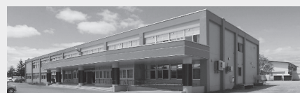
北広島団地地域サポートセンターともに