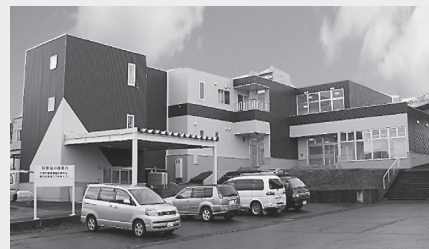
地域交流ホームふれて

2010年には地域の生活課題解決を目的に廃業したスーパー銭湯を増改築し、1階に地域交流スペースおよび地域包括支援センター、2階に通所介護を配置した北広島団地地域交流ホームふれて」(以下、「ふれて」)を開設。さらに、2014年北広島団地地区内(以下、団地地区)の開校した小学校を利活用し北広島団地地域サポートセンターともに(以下、「ともに」)を開