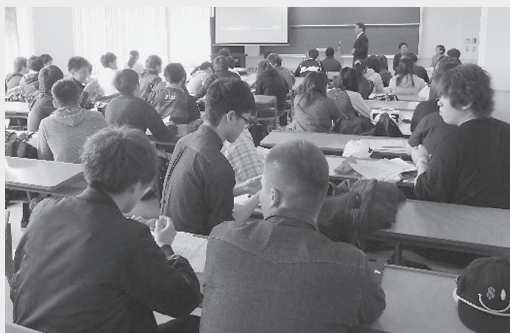
写真9 星槎道都大学と共同開催した 認知症サポーター養成講座