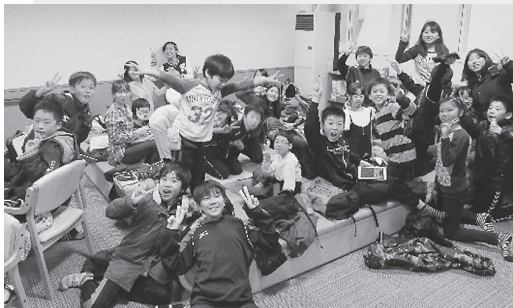
写真1 キッズコーナーで楽しく過ごす子どもたち