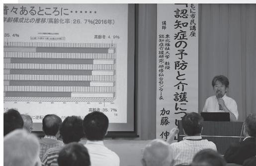
写真8 当法人の知識や経験を生かした 認知症予防についての市民講座