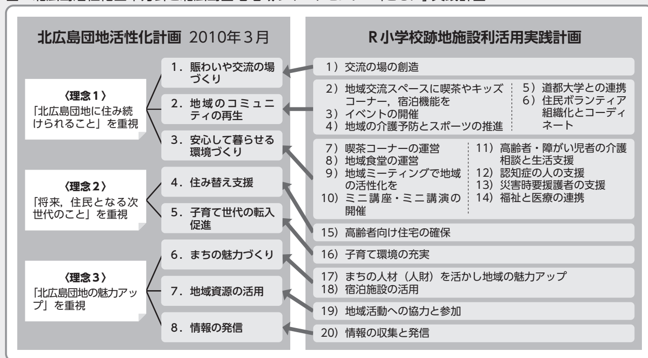
図 北広島活性化基本方針と北広島団地地域サポートセンター「ともに」実践計画

少子高齢化に伴い、北広島市は団地地区内の小学校を統合し、廃校となった2校のうちの1校を当法人が運営することになった。先に開設した「ふれて」運営の際も同様だが、2010年3月、北広島市が策定した北広島団地活性化計画基本方針の3つの理念のもと、小学校跡地が持つ特性を活用しながら、地域活性化に貢献することを目的とした事業である(図)。