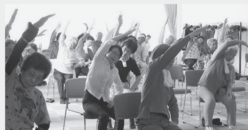
写真3 週2回行われる生き生き100歳体操

市内にある星槎道都大学には社会福祉学部と美術学部があり、「ふれて」で絵画を展示したり、大